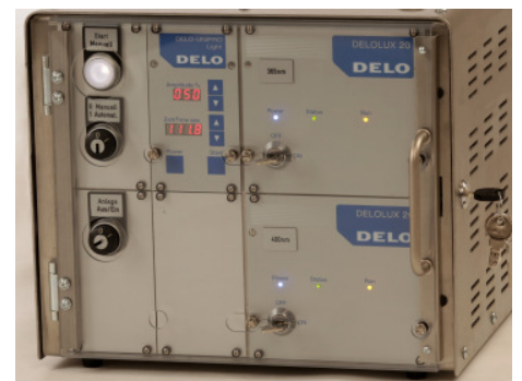
Steuerung mit abschliessbarer Abdeckung der Bedienelemente

Nutzungsdauer von über 20.000 Betriebsstunden und garantieren eine homogene Lichtintensität. Die flexibel montierten LED-Flächenstrahler bieten die Möglichkeit, größere und kleinere Flächen zu härten, indem bis zu 2 LED-Einheiten nebeneinander angebracht werden können. Außerdem ist eine hohe Betriebssicherheit gewährleistet, da sich die Tür automatisch verriegelt, sobald der Aushärteprozess beginnt. Dämpfe, die während des Aushärteprozesses entstehen könnten, werden aus der Kammer abgesaugt. Ein zusätzlicher Wahlschalter ermöglicht einen Automatikstart (Türe wird geschlossen, Strahler werden automatisch gestartet) und einen manuellen Start (z.B. bei Laborbetrieb). Optional kann auch eine Verriegelung der Bedienelemente geliefert werden.