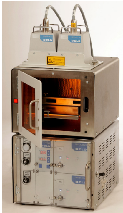
UVO flex 2-teilig LED 1x2

UVO flex 2-teilig LED 1-2 ist ein kompakter Aushärteofen mit Edelstahlgehäuse und verstellbarem Einschubfach. Durch den 2-teiligen Aufbau kann die Belichtungskammer ergonomischer am Arbeitsplatz aufgestellt werden. Die verwendeten LED- Flächenstrahler DELOLUX 20 ermöglichen eine